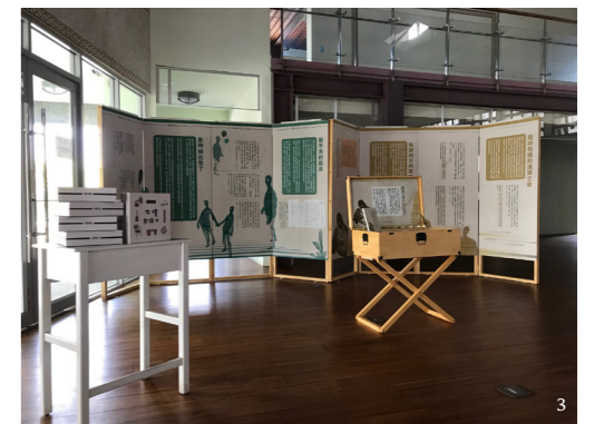
1 | 「臺灣文學虛擬博物館——文學展示」線上展覽。 2, 3 | 文學行動展，前進臺南聖功女中。。