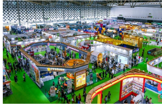
除了書籍之外，插畫原畫展更是非常值得參觀之處。