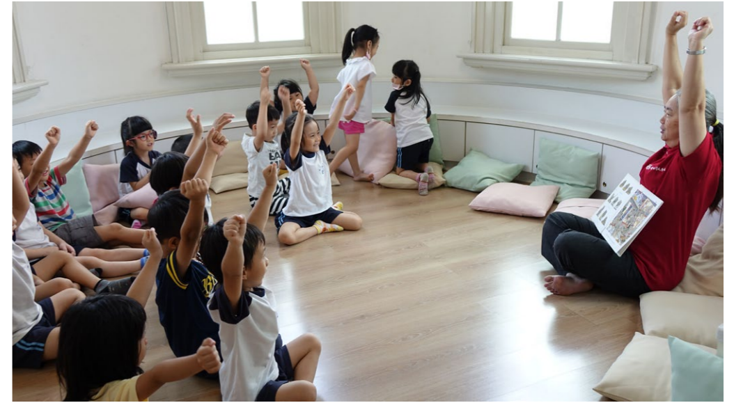
透過說故事活動，孩童們用不一樣的方式享受閱讀之樂。