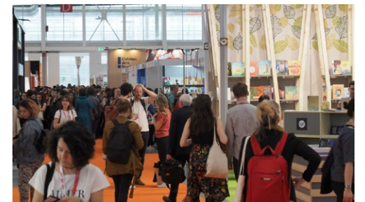
2019 年波隆那書展一隅。