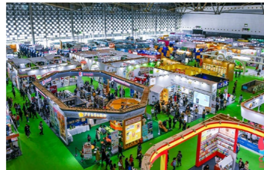
除了書籍之外，插畫原畫展更是非常值得參觀之處。