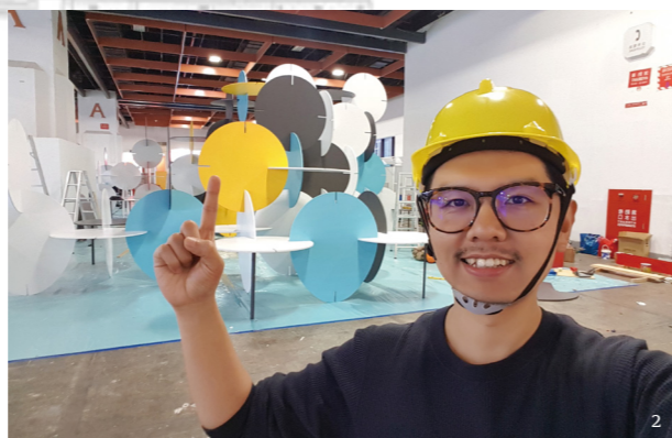
2 國際書展的展位施工時，親自監工也是必要的！