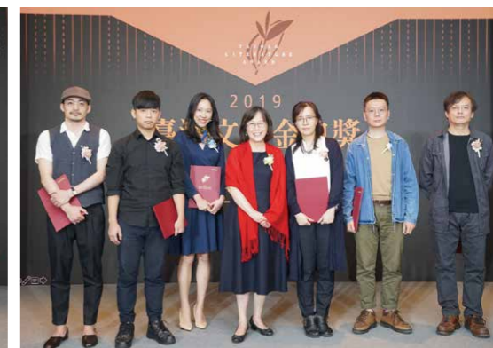
贈發圖書類入圍證書