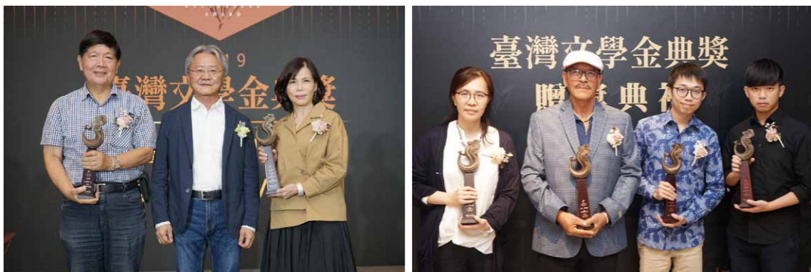
臺語新詩創作獎贈發