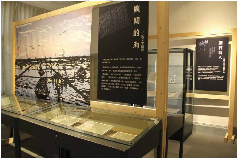
以各主題展示相關文物。

郭水潭是日治時期少數擅長創作俳句、短歌的詩人，現代詩的創作也有極高的成就，儘管面臨跨語一代的書寫困境，仍然筆耕不輟，記錄下故鄉與親情的美好。在展出手稿多為日文創作的情況下，選擇以日語朗誦、詩作意象主視覺、作家日記小故事……等不同的敘事模式，突出作家的個人形象和時代背景，引導觀眾透過感官與書寫，認識郭水潭的創作風格及其在文學史的特殊定位。