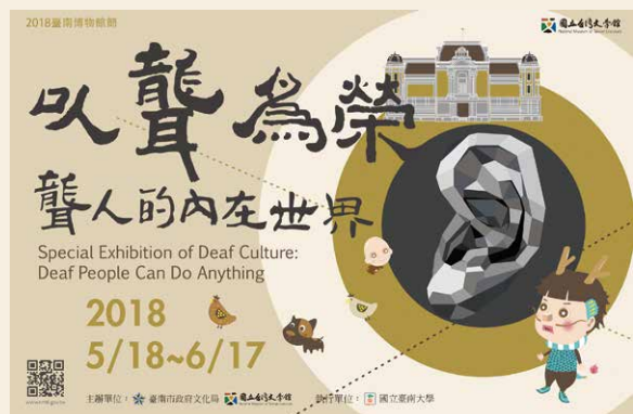
「以聾為榮」特展海報。