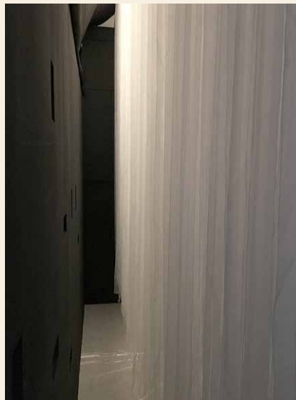
展場設計互動裝置作品《我們的聽覺十分依賴所見及所感》，觀眾在裡面可以透過觸感和視覺，體會失聰者的世界。

臺灣文學館為聽障友善博物館且致力推動文化部保障公眾之文化平權的政策，因此積極邀請聾友參與文學館各種藝文活動，期盼能提升其文化與社會參與的素養。面對未來的世代，相信社會參與的藝術實踐將扮演著相當重要的角色。當藝術文化活動與藝術家更自由解放時，我們不僅可以對自我的文化與形象更了解，也學習到藝術是不同社群生活的表達，讓每一個活動參與者在過程中得以體驗與學習，這對觀眾而言可能是內在心靈的革命與培力，可以為一個社會與世代帶來漸進的改變力量，因為人與具有創意的活動才是文化生產的主體。☒