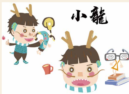
吉祥物「小聾」為展覽增添互動素材。