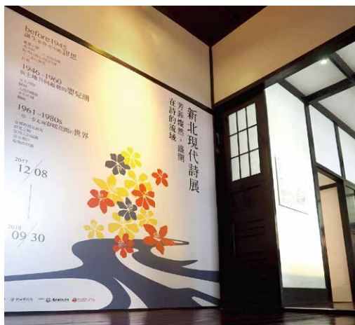
展場入口處的主視覺意象。

為此，本展的主視覺融合了新北市的市樹——臺灣山櫻，呼應「芳菲燦然，盛開在詩的流域」展題。主色調氛圍則採用與齊東詩舍幽雅環境相近的配色，並利用演色關係，以淺黃色為基底，深藍及橘紅色輔助，帶動整個展覽承先啟後的概念。山櫻圖案之下是蜿蜒於盆地之間的淡水河系，傳達川流不息的意象，亦可以解讀為交纏在土地之下的緊密根系，成為繁花與土地之間最直接的血脈聯繫。