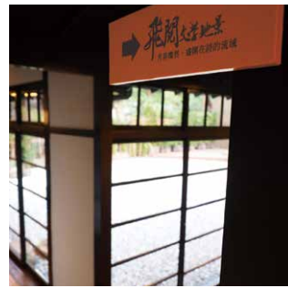
展場後方的多媒體單元「飛閱新北文學地景」影片區。