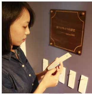
展場內的文青風格「詩籤」，供民眾免費攜回紀念。