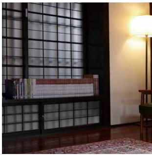
新北現代詩集作品閱覽區。

另外，我們從本展的「誕生於烽火中的謬思—before1945」、「與土地共同起飛的嬰兒潮—1946-1960」、「一步一步走向春暖花開的世界—1961-1980s」三個單元中，各選取五位作家，再從其中各挑選一首詩作，製作成精巧的十五組「詩籤」，掛在展場中的特製牆面上。觀眾可以直接在牆面上欣賞不同世代的詩作，並將喜歡的詩籤取下帶回家，詩籤的背面有作家小傳及展品書封影像，讓觀眾對作家、作品及出版品有更深刻的印象。