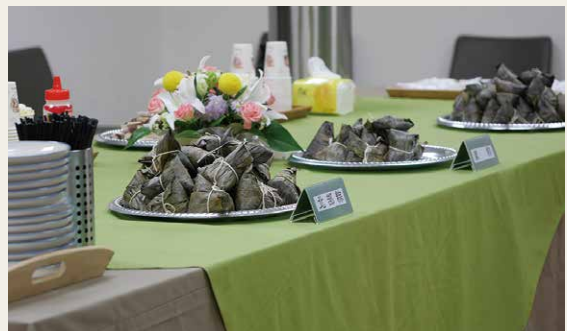
「齊東詩舍2017詩人節」以米粽、茶品及歷史建築佐詩。

齊東詩舍矗立在臺北最古早的米道旁，作為詩的復興基地。這裡是詩人的家，亦是推動臺灣詩文學、社區互動及維護文化資產的堡壘，這樣的結合，寓意深遠。「齊東詩舍2017詩人節」活動，透過文學、米粽、茶品及歷史建築，從內而外，有形乃至無形文化的體現，讓我們更能感受詩舍靜謐溫柔的詩意氛圍。雨水滴簷聲、詩人吟唱聲、觀眾讚嘆聲，今年的詩人節，在幽靜的日式宿舍裡，圓滿呈獻了一場跨越族群的美好慶典。☒