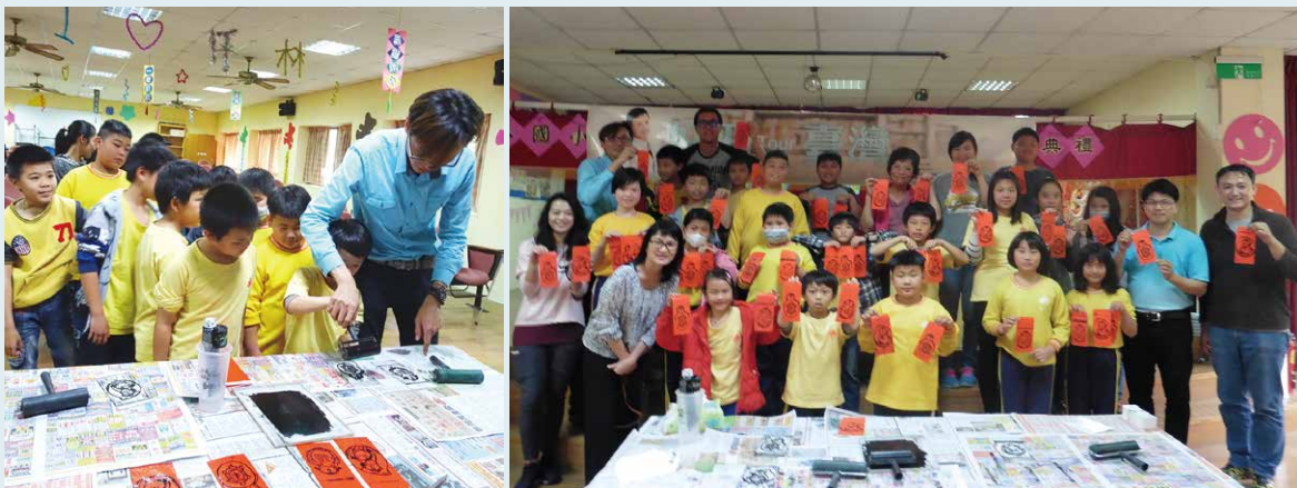
為了讓師生體驗這本書插圖的版畫創作過程，江老師指導師生在版畫板上塗上油墨，轉印於紅包袋上，成了獨一無二的紀念品。

為了讓師生更進一步體驗這本書插圖的版畫創作過程，江老師準備了小桃妹圖案的版畫用具，親自指導師生在版畫板上塗上油墨，轉印於紅包袋上，成了獨一無二的紀念品。在欣賞版畫紀念品時，我也和學生特別說明，江老師選擇以版畫方式製作小桃妹書中插圖的理念，是這本書的一大特色，也是一件不容易的事。因為在時下電腦繪圖技術與質感日益進步下，江老師捨棄快速方便的做法，改以傳統版畫方式，從刻板圖案到套色來印製所有的插圖，所需耗費的時間與精神，相對的高出數倍之