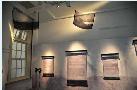
自然書寫的作品會成為生態的墓誌銘或是上訴狀？

自然書寫的作家們透過實際的行動觀察自然、透過實際的行動保護環境，他們的行動讓我們看到自然環境的變化，也用他們的行動告訴我們「起來