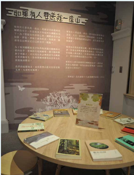
「書寫自然」展區，讓觀眾瀏覽文本、透過閱讀看到自然的美麗與哀愁。

性自然書寫」三大類，其中所包含的議題及面向隨著時間的變化，多元而豐富。環境議題報導作品如《我們只有一個地球》、陳煌主編的《我們不能再沈默》、楊憲宏的《走過傷心地》等；簡樸生活文學有陳冠學的《田園之秋》、區紀復的《簡樸的海岸——鹽寮淨土十年記》、孟東籬的《濱海茅屋札記》等。文學性自然書寫，可謂「包山包海」，沈振中的《鷹兒要回家》、洪素麗的《守望的魚》、吳明益的《蝶道》、七寇·索克魯曼的《我聽見群山報戰功》、夏曼·藍波安的《冷海情深》、陳玉峯的《人與自然的對決》，讓我們從不同的眼光認識自然。