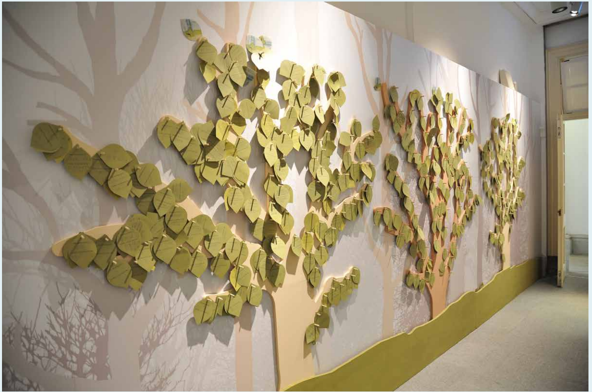
一片葉子，代表一個印象深刻的文句、一個改變境的綠色行動。

成為一個行動者」。本區以「互動選擇題」的方式，透過「你喜歡大自然嗎？」、「你感受到環境正在改變？」、「環境破壞的問題曾經影響到你的生活？」等問題，引導觀眾認識關注各種議題的環境團體，透過社群的關注，帶來知識，知識帶出影響力。展區最後，觀眾可以從展覽摺頁上取下葉形的留言卡，寫下展區中印象深刻的文句，並與大家分享，自己的「綠色行動」是什麼？