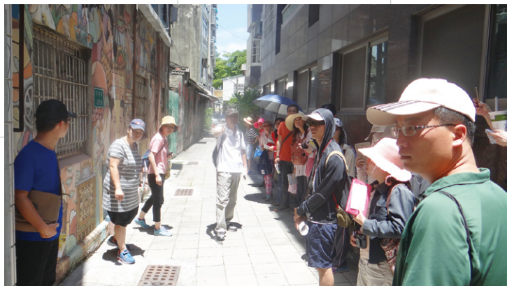
位於祀典武廟及大天后宮附近的葫蘆巷。

打銀街（今忠義路一帶），清朝名曰四平境打銀街，日據時代改名白金町，臺灣光復後拓寬。文史工作者一般認為，葉老祖厝應是位於今忠義路國花戲院現址。