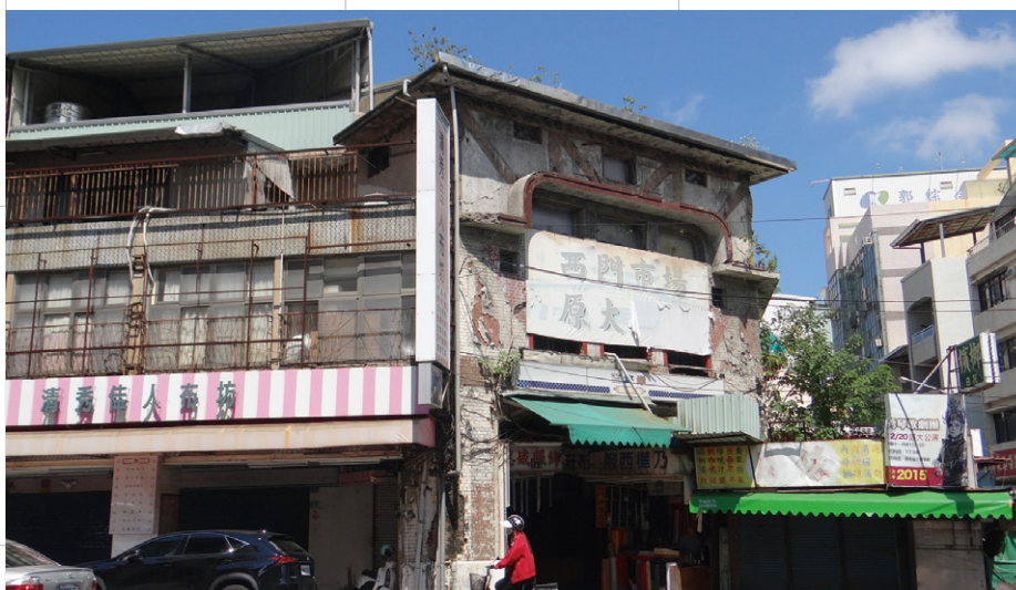
昔日的西市場入口，隱身於道路旁。

雖然數十年來的歷史發展讓城市紋理有了變化，但透過走讀葉老文學作品仍可再次追溯並且發現更多現代元素已經結合其中。一座城市不會只有過去式，新舊交融的府城正充滿獨特魅力，並且繼續散發迷人丰采。☒