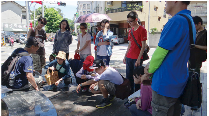
帶著文學去旅行，感受葉石濤筆下的場景。

我是民國14年生於臺南府城四平境打銀街葉厝……從幼我叫慣了歷史悠久的古街名，所以雖然日據時期改名為白金町，光復後取名為民生路