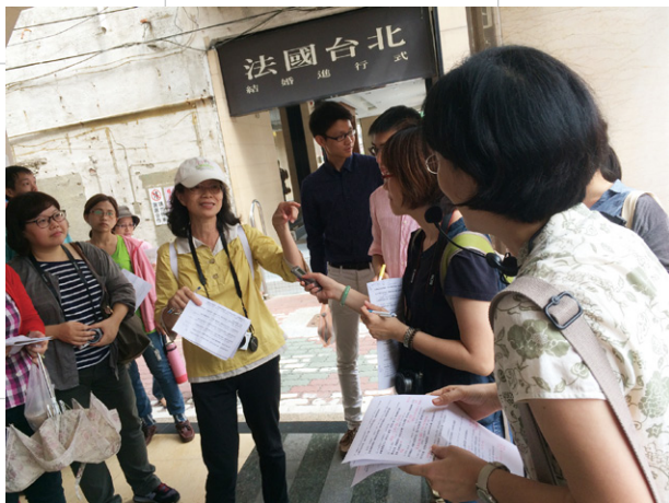
文學踏查及走讀：「文學旅行聯盟」活動現場。以五條港為歷史場景，討論古今飲食。

集影像的過程，這些將會在他們的凝視中，成為或深或淺的記憶，而文學在其中，會被留住多久？