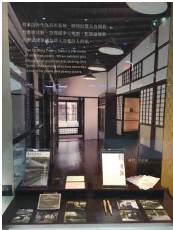
文資修復 詩的基地。

官邸。2009至2012年進行修復整建工程，2014年由國立臺灣文學館進駐管理並對外營運，定位為詩的基地，使靜謐優雅的歷史建築成為詩人及愛詩人的家。除了辦理展覽，也舉辦各類教育推廣活動，並有咖啡店、文創賣店等提供服務，空間採多元規劃。此區以齊東詩舍建築為主視覺，配合臺文館重要詩文類的出版品《全臺詩》展示、文創商品，凸顯臺灣詩文的驚人潛力與價值。