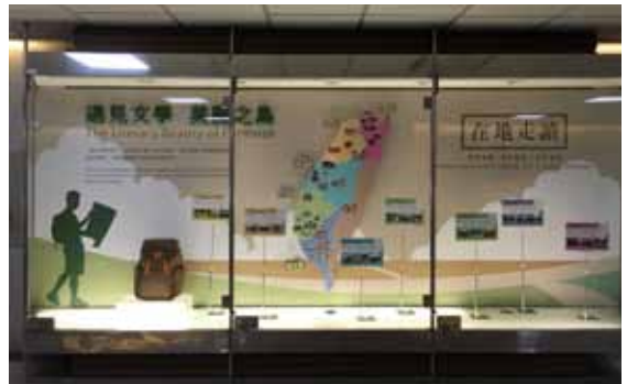
遇見文學 美麗之島。