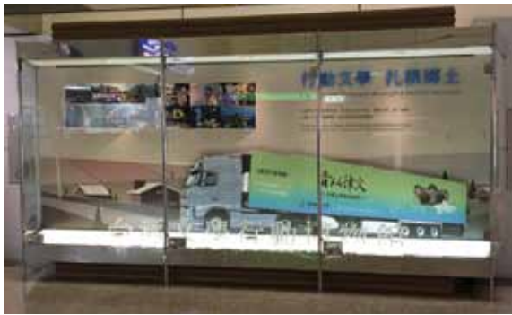
行動文學 扎根鄉土。