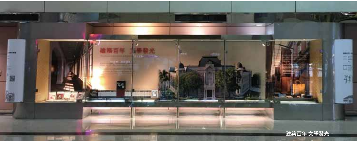
建築百年 文學發光。