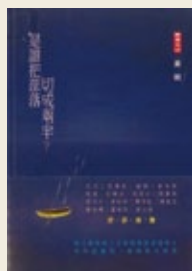
黃岡《是誰把部落切成兩半？》 二魚文化出版