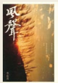
李長青《風聲》 九歌出版

她的確在題材上一直在挖掘，在寫作形式上也透過設計，以各種方式達到藝術的效果，的確有很突出的表現。