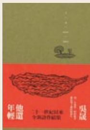
吳晟《他還年輕》 洪範出版