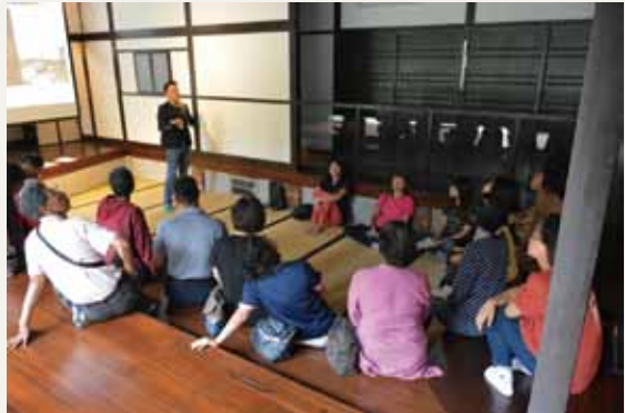
齊東詩舍喜迎南投賓客，從詩舍修復、業務討論到展覽參觀，兩館就文學推廣經驗互動交流。

午後的齊東詩舍，鳥鳴與松鼠的叫聲正彼此唱和著，苦楝樹隨著微風輕輕搖曳，正歡迎從風景秀麗、人文特色顯著的南投即將到來的賓客。