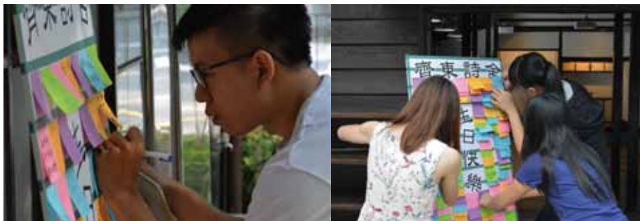
民眾熱烈參與留言活動，一字一句寫出對齊東詩舍的衷心祝福與期望。