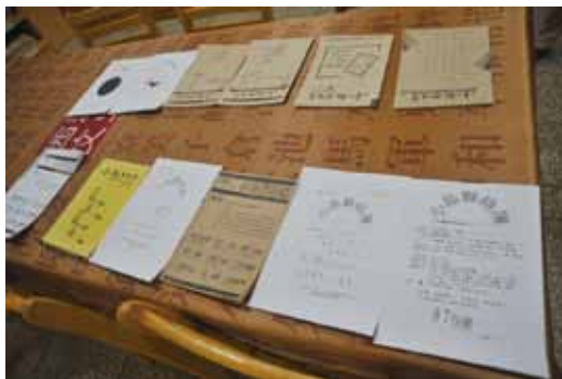
澎湖在地刊物《小島聯絡簿》。