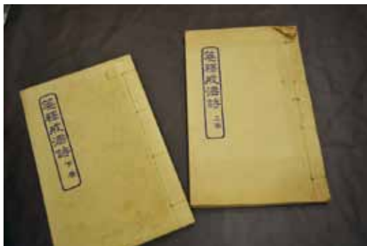
澎湖生活博物館典藏之《箋釋戒淫詩》係鋼版印刷，手稿本則藏於「澎湖文獻中心」。