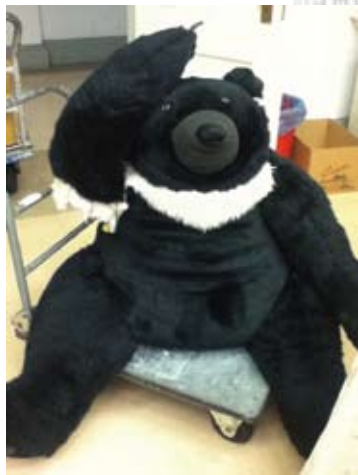
展示道具的台灣黑熊布偶，不耐觀眾的熱情時常要進廠維修，只好提前畢業。

2010年4月展覽開展後，因籌備製作期十分緊迫及經費有限，無法考量長期展示與展品典藏的各項需求，隨即面臨多媒體設備及展示環境如何承受5年展期的問題。為使展覽得以存續5年，展場內各項大小事物，皆經過多次評估並規劃長期的維運計畫。為了改善展示環境的問題，各展區進行濕度控制設備的加裝，以穩定展櫃內濕度。台語區使用日光燈照明的展櫃，照度達上千勒克斯且一般日光燈有紫外線問題，展品雖非脆弱文物而是一般圖書，但長期展出恐有單頁色差以及參觀環境照明舒適度的問題。改善方式以抗UV膜包覆日光燈隔絕紫外線，加裝LEE 210減光色紙減低照度至80~120勒克斯。值得一提的是，囿於展示櫃已製作完畢，進行照明改善需以現場狀況來發想改善方式，因此特別設計壓克力架，以安裝多層減光色紙。本館為國定古蹟，門窗遮風避雨的效果不若有氣密門窗的新建物那麼好，加上外圍是草地難免會有濕氣及生物出沒，因此進行長期的溫濕度紀錄與生物監控，以了解展場整體環境，進行預防性的調整。多虧有預防性的監測，能早期發現侵害裝修材料、展示道具的煙甲蟲、竹蠹蟲、粉蠹蟲等，立即進行緊急處置並聯繫除蟲公司以「幫家淨」進行展場煙燻。後續監控結果，生物危害狀況已改善。開展初期，展場內的多媒體播放設備幾乎都是DVD播放器，長期使用後會有無法讀片、跳針