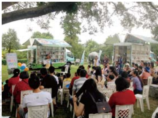
高雄佛陀紀念館舉辦胖叔叔說唱歌謠活動。