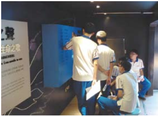
桃園中壢高中的學生們聚集在「常民之聲」展區聆聽口耳相傳的神話與傳說。

學習單，讓學生探索行動博物館，並相互討論，提升學生對於台灣文學的興趣；參訪過程中也有許多學生對於台灣文學能有如此多種的呈現面貌，表示非常驚訝，顯現出學生對於台灣文學的刻板印象只停留在文章詩詞，且未曾接觸過文學其實可以有如此多樣化的呈現方式；平日展出期間，放學後也有許多學生會三兩結伴地進來行動博物館內參觀。學生多半對於館內展出設備覺得相當新奇，也因此會花較多時間駐足觀賞、研究。