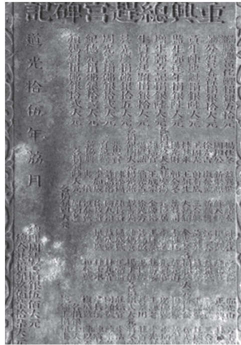
圖9 「重興總趕宮碑記」 。